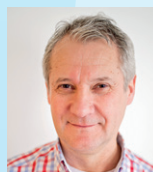
Zbigniew Rakovski Produktion & Montage