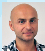
Mateusz Piecuch Produktion & Montage